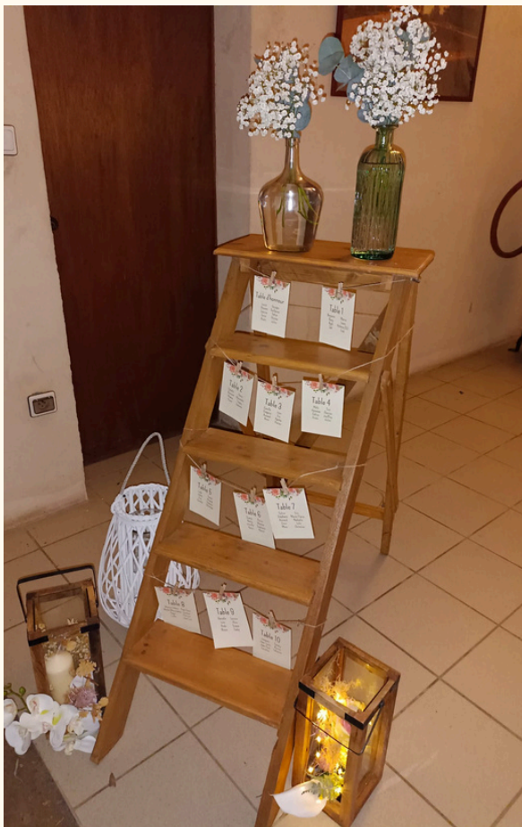
Escabeau 4 marches Loué sans décoration

Plan de table, candy bar, support à souvenirs.. Sortez des codes!