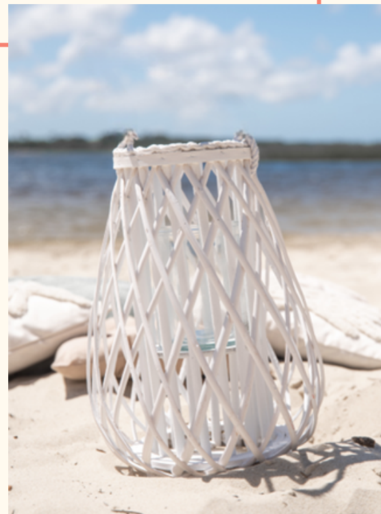
Lanterne en rotin blanche Hauteur 40 cm / Qté 4 10 euros pièce

Les lanternes naturelles apportent charme et élégance en toute circonstance!