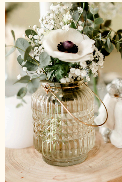
Bougeoirs en verre