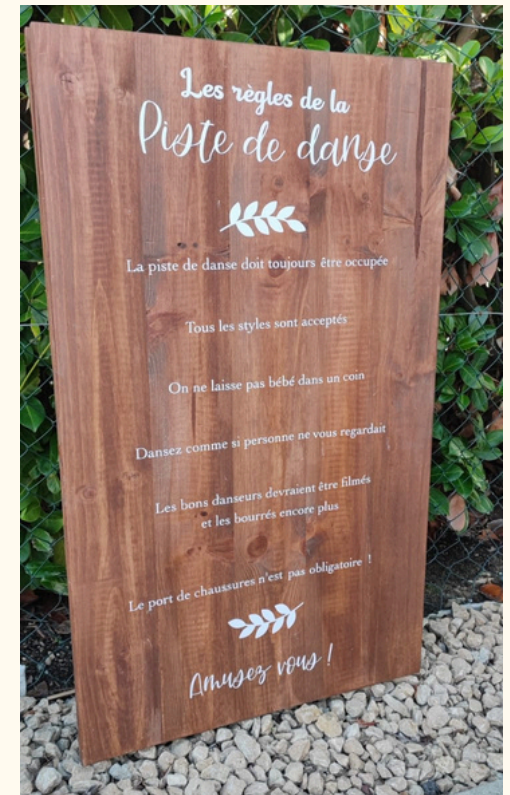
Panneaux “Bienvenue à la cérémonie” et “Les règles de la piste de danse” Dim: 1m x 60 cm 30 euros pièce