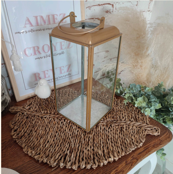
Lanternes métal doré Hauteur 30 cm / Qté : 4 8 euros pièce