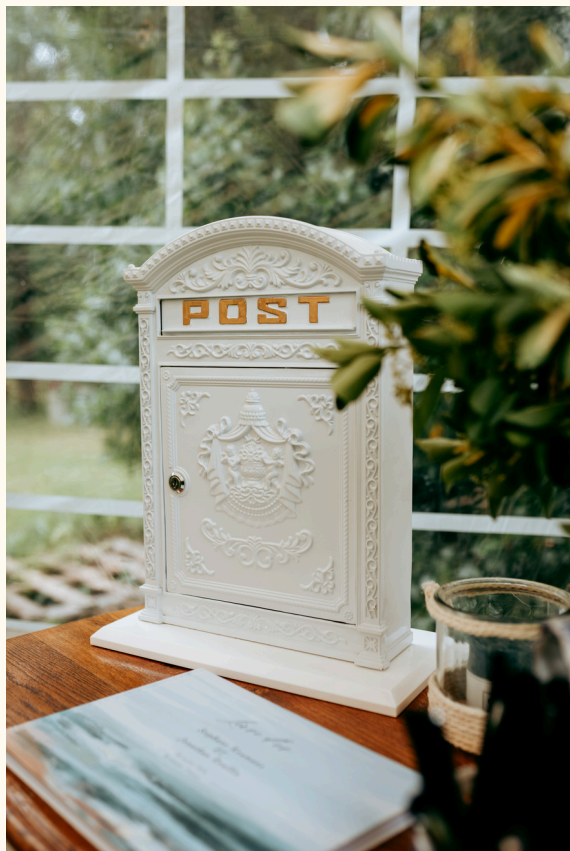
Boîte aux lettres avec clef 20 euros