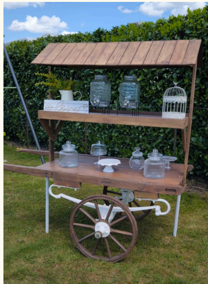
Charrette en bois ( démontable pour le transport ) 70 euros pièce