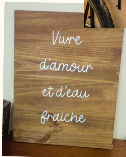
Petit panneau Dim: 38 x 27 cm 10 euros pièce