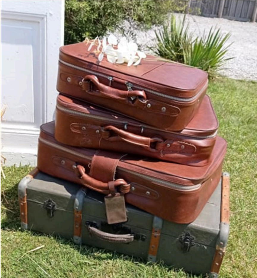
Lot de 3 valises en cuir 15 euros