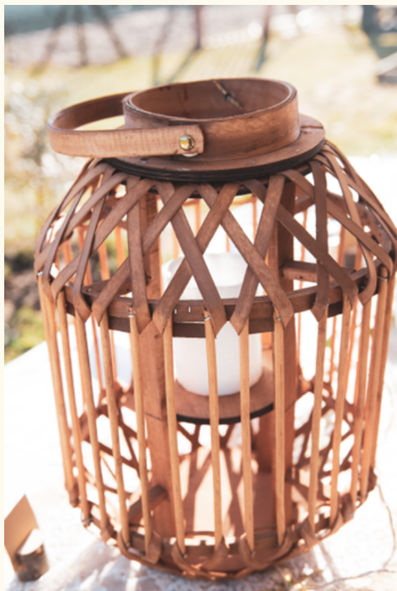
Lanterne aspect bois Hauteur 40 cm / Qté 2