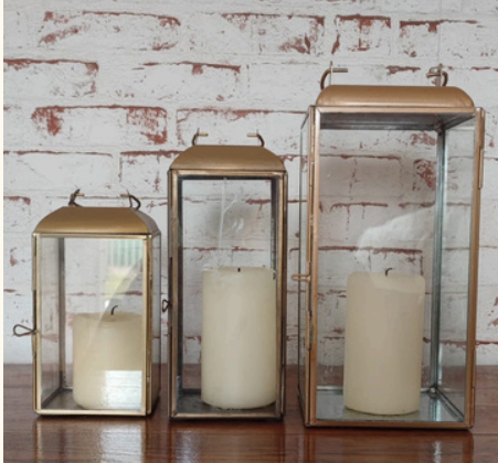
Lanterne métal doré Hauteur 20 cm / Qté : 2 Hauteur 25 cm / Qté : 1 5 euros pièce