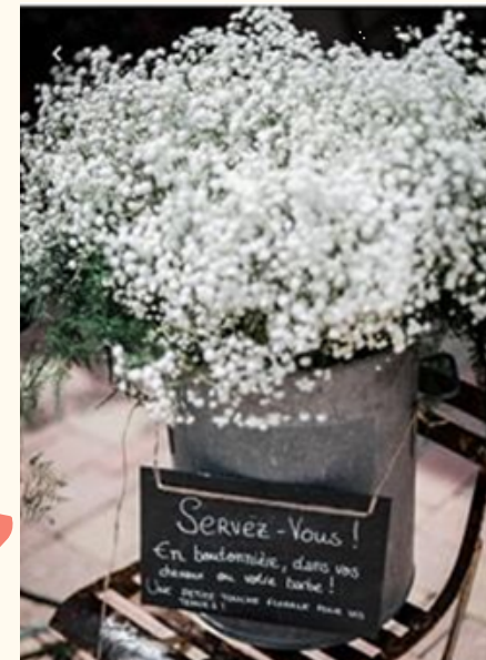
Lessiveuse 15 euros