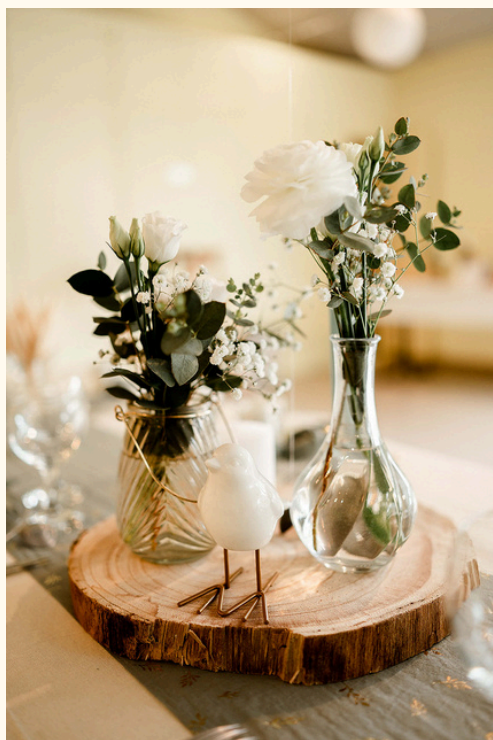
Rondin de bois