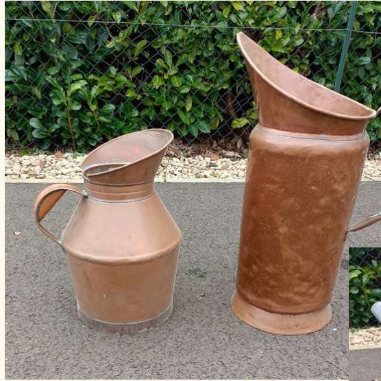
Arrosoirs 5 euros pièce