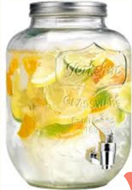
Bonbonnes à réservoir 4L Qté: 3 8L Qté: 3 6 ou 12 euros pièce