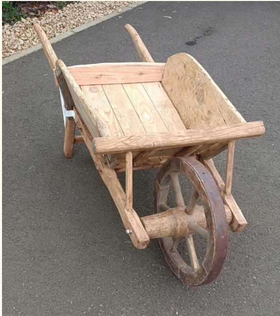
Brouette en bois 15 euros