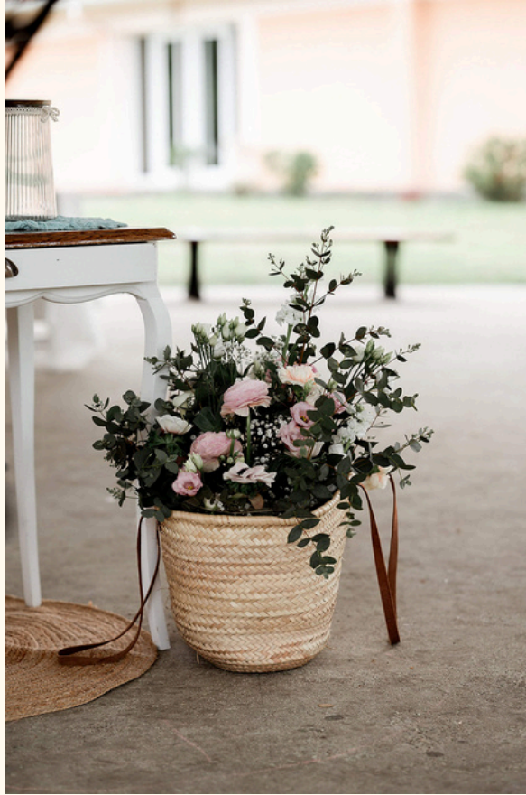
Panier osier avec anses cuir Qté 2 5 euros pièce