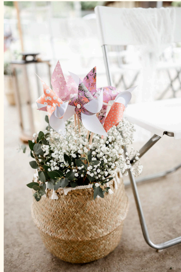
Panier osier contour à pompons Qté 6 5 euros pièce