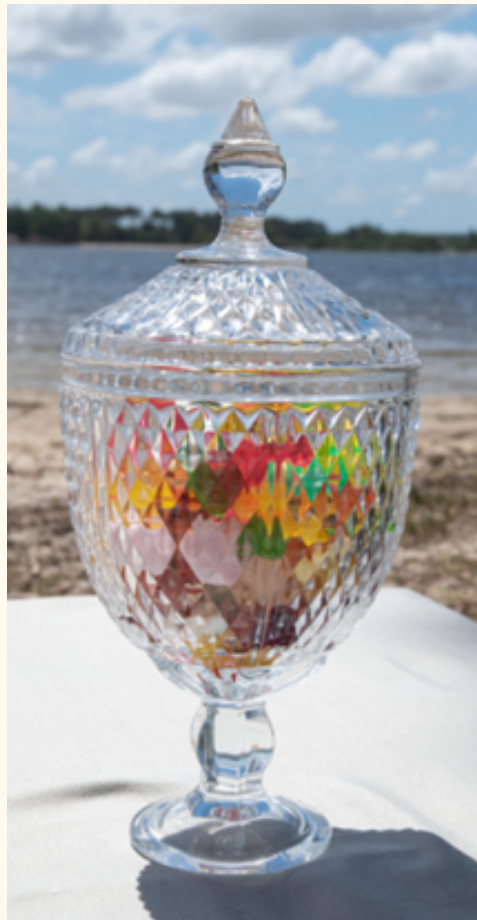
Bonbonnières Diverses formes et quantités!