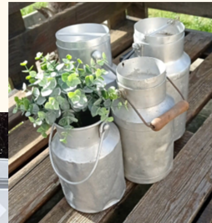
Pots à lait (différentes tailles disponibles) De 1.50 à 10 euros